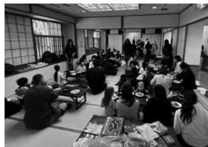
第7回だれでも食堂食事中の様子

「檜原たねとつち」では、檜原村の自然や地域資源を活かし、子どもたちが安心して過ごせる居場所づくりに取り組んでいます。2025年11月、檜原学園マラソン大会後に、やすらぎの里3階和室で第7回だれでも食堂を開催し、80名以上の参加がありました。豚汁など村の食材を使った温かいご飯や災害備蓄食を提供し、防災に触れる機会にもなりました。参加者やボランティアの方からは、地域のつながりを感じられたなど温かな声が寄せられました。今後も多世代が安心して集える場を、地域の皆さんと共につくっていきます。応援のほどよろしくお願いいたします。