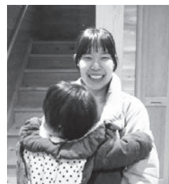
子ども共々、今年もよろしくお願いいたします