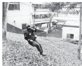
そとあそび体験中！

こんな素敵な場所のご近所？いや目の前で、のんびりコツコツ、今年も楽しく頑張ります！