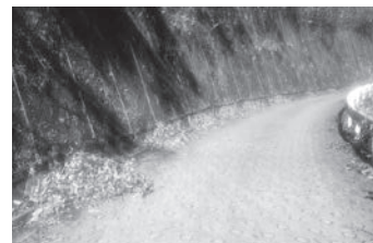
落ち葉集めは、冬の風物詩（笑）

初冬に落ち葉掃きをしてきました。綺麗な紅葉の後には落葉します。歩きながら落ち葉を踏んだ時の「サクッ、サクッ」という音は楽しいものです。一方で、滑る原因となる側面もあります。場所や日当たりによって湿っている葉、乾燥している葉など様々です。落ち葉は堆肥として自然に戻り、畑で活用されるなど循環していきます。改めて檜原村の生活は、持続可能な環境であると感じます！