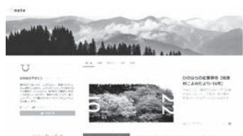
ひのほらマガジンは、こんなページになっています^^

インタビュー記事の他にも、毎月の檜原村での暮らしの様子を伝えるコラムなども公開中です。インターネットで「ひのほらマガジン」と検索して、ぜひ読んでみてください ^^