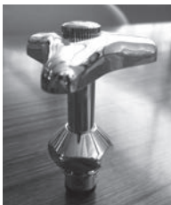
自動凍結防止用コマ