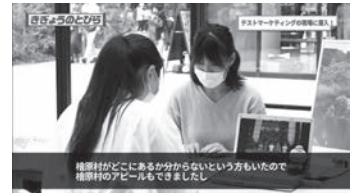
アンケート調査を行いました

協力隊卒業まで後4か月。シェアハウス運営の準備を着実に進めていき、村に若い女性を増やしたいと思います。