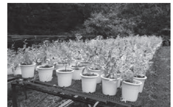
大切に育てられているムラサキ！

種の付いたムラサキは、鉢から30cm程の高さに切り、こげ茶色の種が付いた部分を集めます。切ったムラサキの茎の先には、これから色が変わる緑色の種も付いていました。もったいないと思い、聞いてみると「これ（10月中旬）以降は、根に栄養を送るために種の付いている部分は切ってよい」のだそうです。鮮やかな紫色の根は、昔から染め物に使用されてきました。日々の活動を通して、またひとつ学ぶことができました！