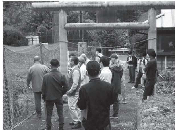
村独自の電気柵を設置した畑で、検討しました

今後も猟友会や関係機関と連携し獣害対策を推進していきます。しかし山の中に生息する野生動物を駆除しても地域に住み着いたり、出没する野生動物を減らさなければ獣害被害は減りません。今後ご理解・ご協力よろしくお願いいたします。