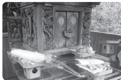
日枝神社の清掃と神事に参加しました