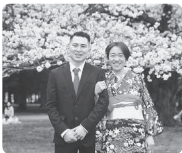
家族になりました！♡

今回は皆さんにご報告があります。私事ですが、今年の4月にかねてより交際していた方と入籍をいたしました。丸3年交際をし、そのうち約2年間檜原村で生活を共にいたしました。未熟な私達をこれまで温かく見守って下さった皆様に、心よりお礼申し上げます。