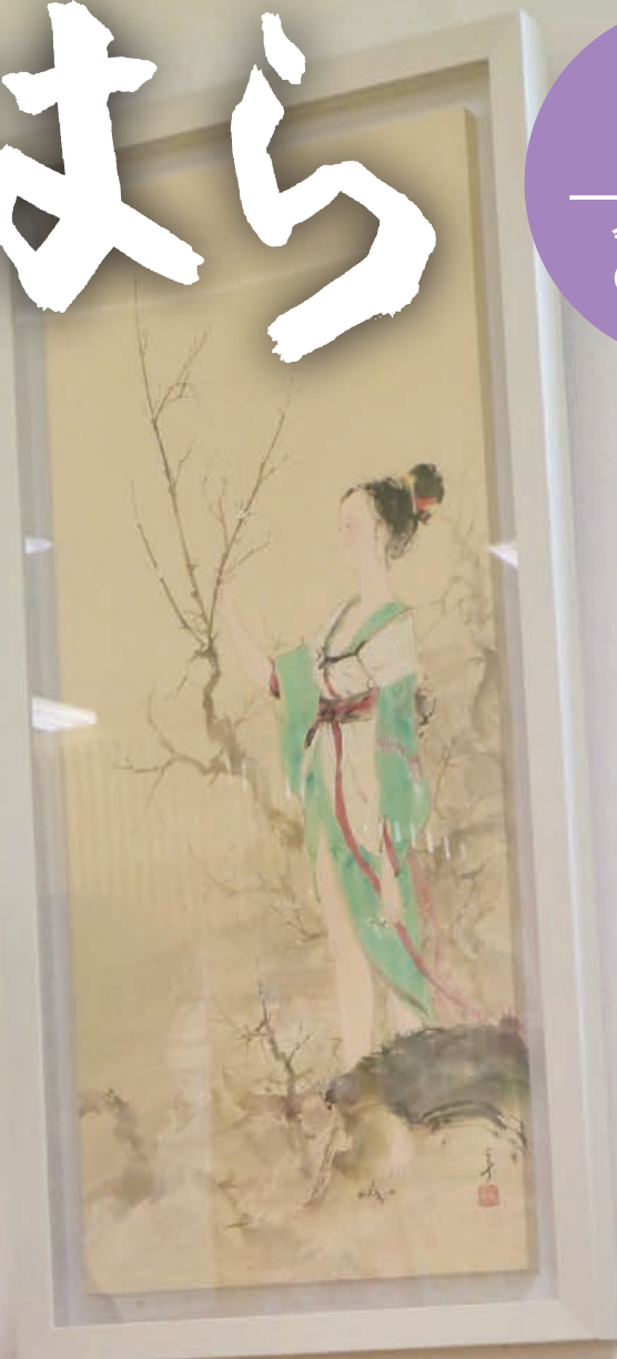
春驟雨に立つ女 号 高橋 吉平