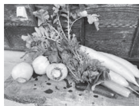
採れたて新鮮野菜を頂きました ♪ご馳走様です!

地域おこし協力隊新聞「スプーン」では、「ひのほらごはん」という料理のコーナーで、村の方に料理レシピをお伺い紹介しています。掲載しているレシピ以外にもたくさんの美味しい料理を教えてください、お陰様で私の檜原村流料理レシピも増えました。卒業後にそれを活かせるようにしていきたいと考えています。今年もどうぞよろしくお願い致します。