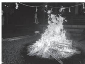
元旦の宝蔵寺の様子