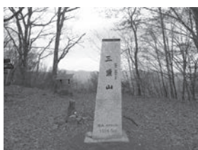
三頭山に行ってきました♪