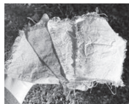
綺麗に染まりました!

昨年11月に紫根染めワークショップに参加しました♪協力隊の活動で普段からムラサキ栽培のお手伝いをさせていただいていますが、実際に紫根で染色をするのは初めてでした。染料の抽出方法や媒染を変えることで、同じ紫根なのに色とりどりの紫色が生まれます。どれも目にやさしい綺麗な紫色で、植物の力はすごいなぁと改めて感動しました。学びたいこと、経験したいことがまだまだたくさんあるので、皆さんこれからも色んなことを教えてください! 本年もどうぞよろしくお願い致します。