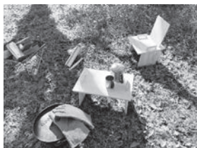
キャンプと木工 DIY キットシリーズ