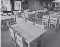
檜のいい香り!店内も明るくなりました。

毎月1、2回ほど、檜原都民の森で作業をしています。最近、檜原都民の森ではボルダリングの壁ができたりと少しずつリニューアルしています。そうした中、管理棟に併設するレストランも店内が明るく綺麗に生まれ変わりました。それと同時にテーブルとイスも新調。実は、このテーブルとイスは私が檜原都民の森の職員と一緒に檜で作ったんですよ。数が多かったので頑張りました!この作品を皆さまにも見ていただきたいと思いますので、この機会に檜原都民の森へ足を運んでみてください。