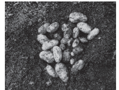
畑も2年目!今年もじゃがいもができました♪

また4月から私の活動として、観光協会のホームページで村の魅力発信のコラムを書いています。村の方に取材し、私自身のこれからの人生の糧となるようなお話を沢山お伺いし、勉強させて頂いております。どちらもお時間のある時に読んでいただくと嬉しいです。