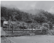
1年前のおもちゃ美術館建設地

暑い暑い夏がやってきました。木工房の隣、おもちゃ美術館は順調に什器の製作が進んでおります。1年前まで更地だったことを考えると感慨深いものがあります。また、村内外問わず多くの方が協力して作る一体感が素晴らしく、完成が待ち遠しいです。