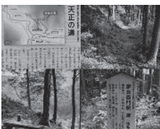
自然と歴史を感じられる天正の道

檜原村に来て4ヶ月が経ちました。豊かな自然だけでなく、最近は歴史や文化にも興味が湧いてきました。協力隊の任期後は、エコツアー等もやってみたくと考えています。実際に各地に足を運ぶこと、皆さんに教えていただくこと、その両面からより深く檜原村を学んでいきたいと思っています。(檜原村の魅力、たくさん教えて下さい)