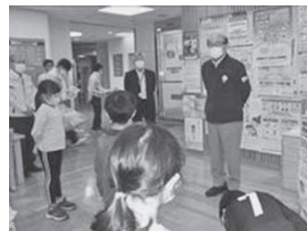
檜原村長からのお話

5月21日(金)には、檜原村役場と連携して、役場の鉢にゴーヤとあさがおの苗を植えました。檜原村長からお話を伺ったり、役場の中で式を進行したりと、教室とは違った学びを行うことができました。帰りには、檜原村グッズをいただき、子供たちは大満足でした。これからも檜原村ならではの体験学習を推進していきます。