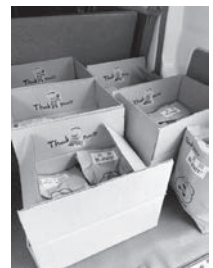
沢山のじゃがいもを届けました♪

そんな今だからこそ、村外の方にも美味しい檜原産のじゃがいもをご自宅で楽しんでもらえるよう、じゃがいも栽培組合の方々と力を合わせ、SNSで販売をさせて頂きました。しあわせのお裾分け、大成功!今後も、檜原村の魅力を多くの人に知ってもらえるよう頑張ります。