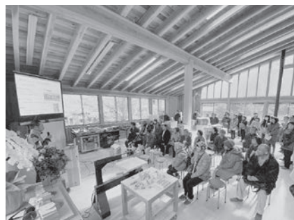
写真はお披露目会の様子です。

年号が令和になり、初めての冬がやってきました。引っ越してから頻繁に見た動物たちも姿を見せなくなり、あゝ冬が来たのだと感じております。ここ1ヶ月ほどは、工房隣の小学校が解体させた悲壮感を感じながら仕事をしていました。さて、小沢の工房ができて随分と時間が経ちました。お披露目会の効果もあり、多くの方にお越しいただいております。お披露目会以降は顔を覚えてもらったこともあり、村の方から作ってほしいという依頼をいくつかもらっております。最近では家具の仕事が増え、前職の力を活かせる機会をいただいているかなと感じています。檜原村に越してまだ日が浅いですが自分ができる仕事を見つけ、多くの方に頼られる存在になりたいです。