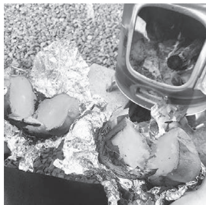
薪ストーブで焼き芋!

いよいよ2020年がやってきましたね。協力隊としての3年間の任期は残りわずかとなりました。私は任期後も檜原村に定住したいと思っていますので、それに向けた準備を進めているところです。さて、私がそう言う「どうしてこんな辺鄙な村にわざわざ住むの?」と聞かれることがあります。その問いに対しての答えは決まっています。なぜなら、この村での暮らしが「自分は生きているんだ」と実感させてくれるから。人口わずか2200人程度の小さな村ゆえの住民同士の顔と顔とが見える関係。そして農業や林業、火事や台風といった自然災害などの脅威も含めた、我々人間の命と自然とのやりとり。きっと私は生まれてからずっと生を実感させてくれる場所を求めているのでしょね。