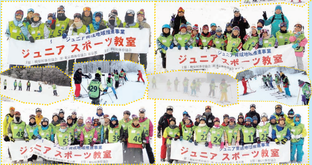
◎ 問い合わせ先 教育課社会教育係 内線 226